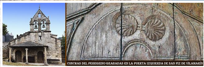
CONCHAS DEL PEREGRINO GRABADAS EN LA PUERTA IZQUIERDA DE SAN FIZ DE VILAMARÍN

Felgresía en la cual estuvo presente la Orden de Santiago (Encomienda de la Barra)